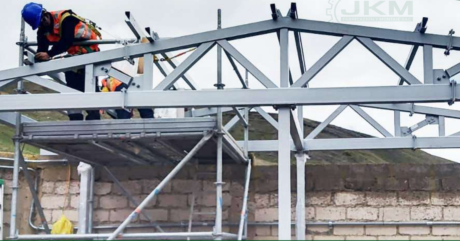
Proyecto Santo Domingo - Puno