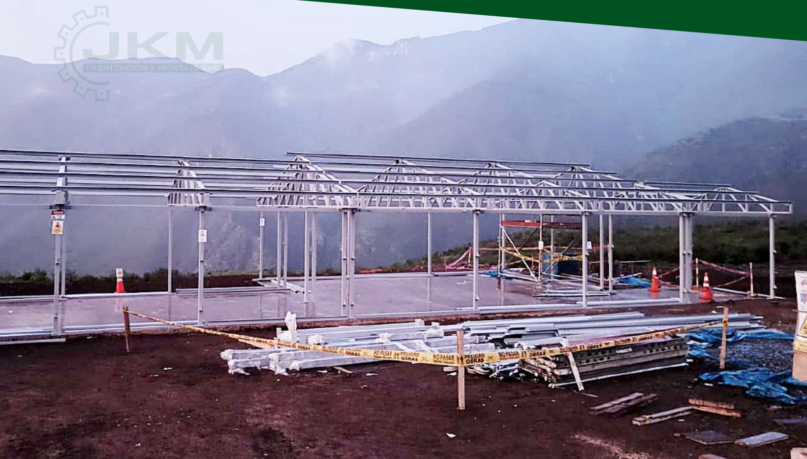
Proyecto Sumac Wayra - Huaral